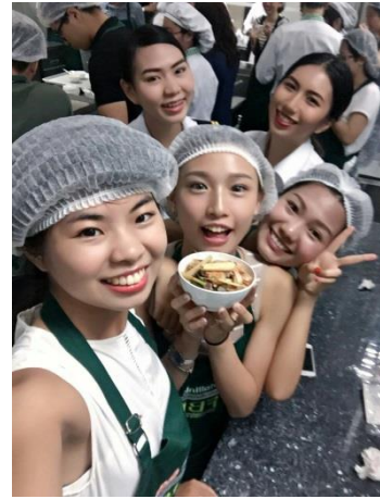
食品實習中心(泰國)