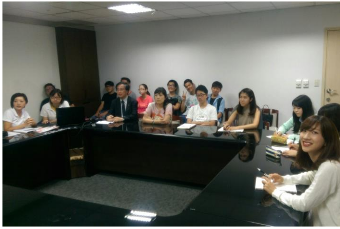
百貨簡介-百貨公司會議室(台灣)