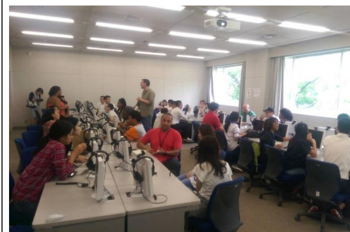
田野調查-行前團隊訓練 (日本)