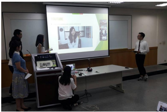
與日本泰國同步連線成果發表