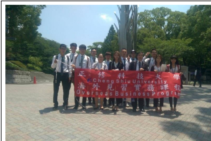
關西大學見習(日本)