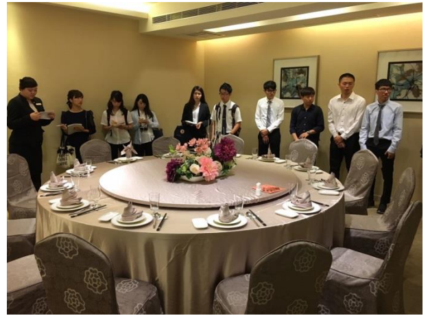
台灣日本學生飯店田野調查(台灣)