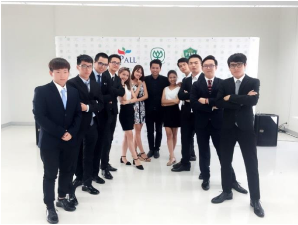
與泰國見習老師合影