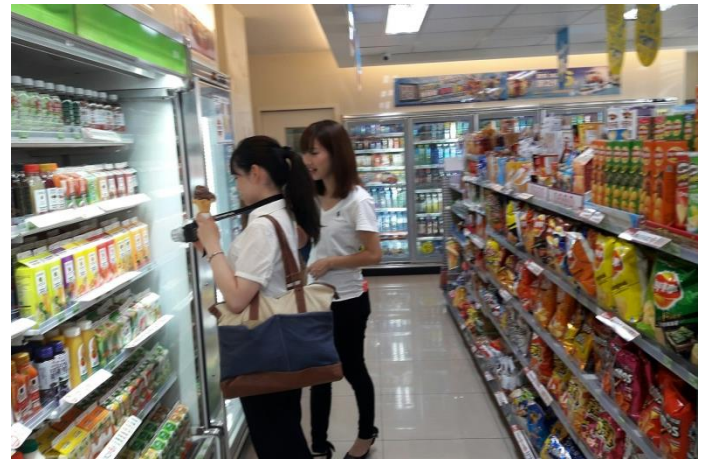
台灣日本學生便利商店田野調查(台灣)