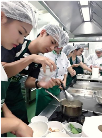
食品實習中心(泰國)