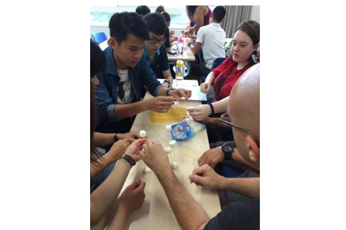
田野調查-訓練團隊合作(日本)