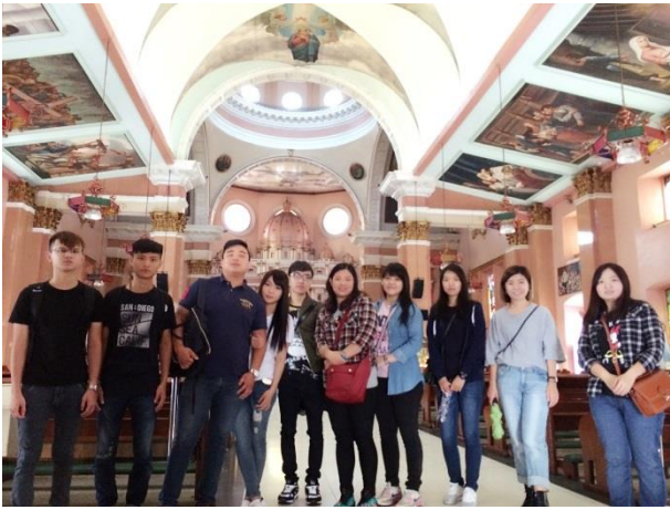
參觀唐人區最老的天主教教堂