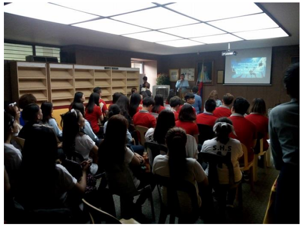
結業典禮(NEC 副校長致詞)