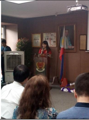
結業式學生心得發表