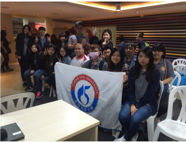
參觀菲律賓最大的冰淇淋(Selecta)工廠