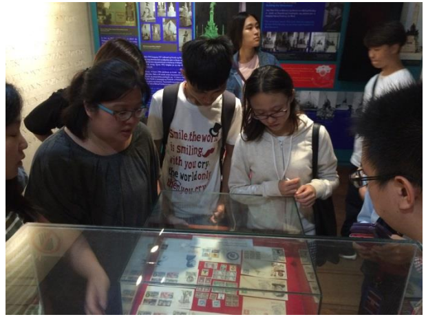
參觀國父紀念博物館