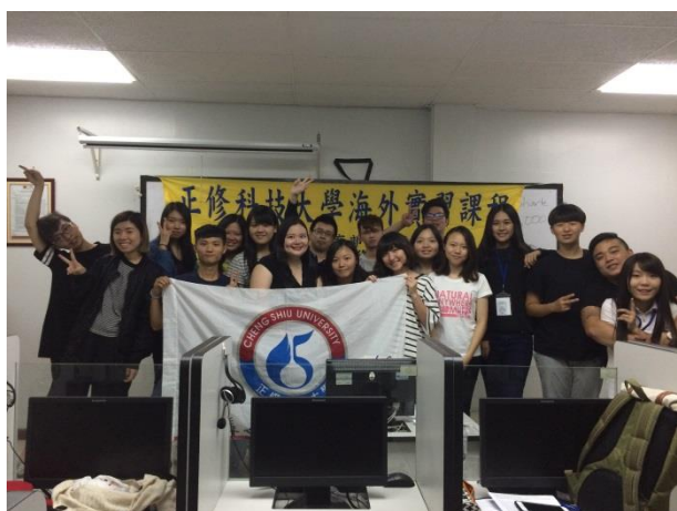
菲律賓文化歷史課程合影